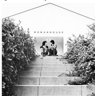
Gráfico n° 10: Proyecto WomEnhouse