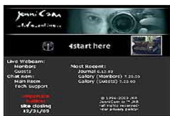
Gráfico nº 6: JenniCam.com