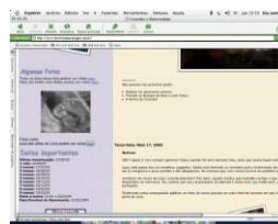
Gráfico n° 2: Weblog - embarazo