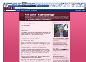
Gráfico n° 3: Weblog -María Amelia