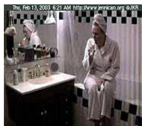
Gráfico nº 5: La vida de Jenni Ringley retransmitida las 24 horas del día