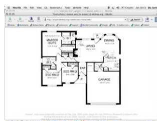
Gráfico nº 7: Voyeur_Web