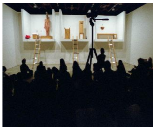
Gráfico nº 4: Marina Abramovic, "La casa con vista al océano" - Sean Nelly Gallery, Nueva Cork, 2002.